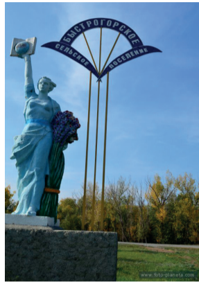
ВЪЕЗД В ПОСЁЛОК БЫСТРОГОРСКИЙ ТАЦИНСКОГО РАЙОНА

Для меня символами района являются парк имени Нечаева на площади в центре станицы Тацинская, новая церковь в станице Ермолаевская с ее необыкновенным убранством. А еще - посёлок Быстрогорский, образцовое место, где живут очень порядочные, вежливые люди.