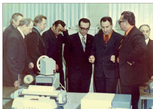
ПОЧЕТНЫЙ ГРАЖДАНИН Г. ШАХТЫ. В. М. ГЛУШКОВ (В ЦЕНТРЕ) НА ВСТРЕЧЕ В ТУЛЕ С ГЛАВНЫМИ КОНСТРУКТОРАМИ АСУ ОБОРОННЫХ ПРЕДПРИЯТИЙ. 1980 г.