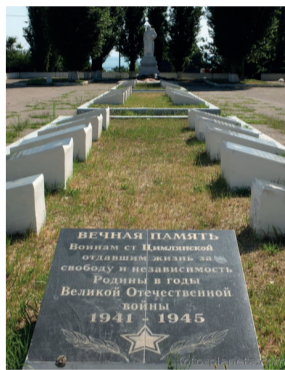
БРАТСКАЯ МОГИЛА УЧАСТНИКОВ ВОВ В Г.ЦИМЛЯНСК.