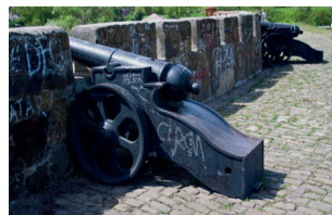
КРЕПОСТНОЙ ВАЛ Г. АЗОВ