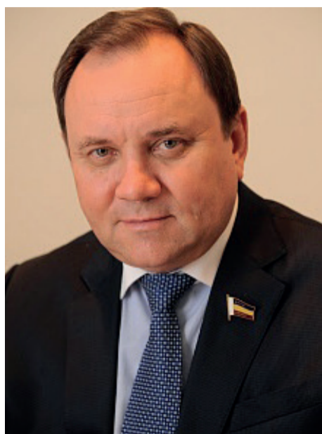
Обращение Председателя Законодательного Собрания Ростовской области В.Е. Дерябкина участникам общественно- просветительской акции «Поезд будущего»

Дорогие друзья, земляки, участники акции «Поезд будущего»! Искренне приветствую вас от имени всего депутатского корпуса Донского парламента!