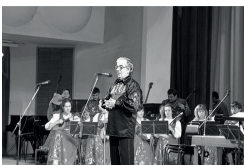
ПОЧЕТНЫЙ ГРАЖДАНИН МЯСНИКОВСКОГО РАЙОНА, ЗАСЛУЖЕННЫЙ ДЕЯТЕЛЬ ИСКУССТВ РОССИИ К.Д. ХУРДЯН