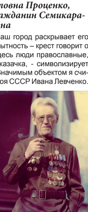
ПОЧЕТНЫЙ ГРАЖДАНИН СЕМИКАРАКОРСКОГО РАЙОНА, ПИСАТЕЛЬ В.А. ЗАКРУТКИН