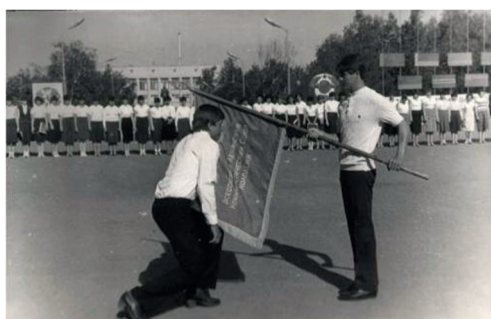
ТОРЖЕСТВЕННАЯ ЛИНЕЙКА В ВЕШЕНСКОМ ПЕДАГОГИЧЕСКОМ УЧИЛИЩЕ. 1980-Е ГОДЫ.