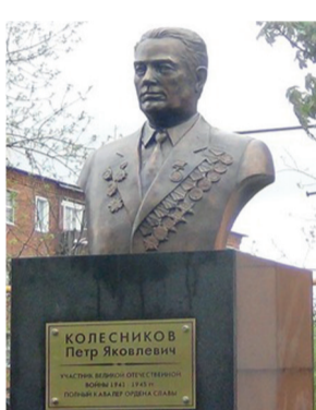
ПАМЯТНИК П.Я. КОЛЕСНИКОВУ Г. ЗВЕРЕВО