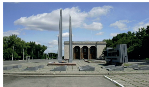
ПЛОЩАДЬ ПОБЕДЫ, МЕМОРИАЛ В ПАМЯТЬ О ПОГИБШИХ ГУКОВЧАНАХ В ВЕЛИКОЙ ОТЕЧЕСТВЕННОЙ ВОЙНЕ

Важнейшие объекты города в моем восприятии - Площадь Победы, мемориал памяти погибшим шахтерам, ГДК «Гуковский», шахта имени 50-летия Октября.