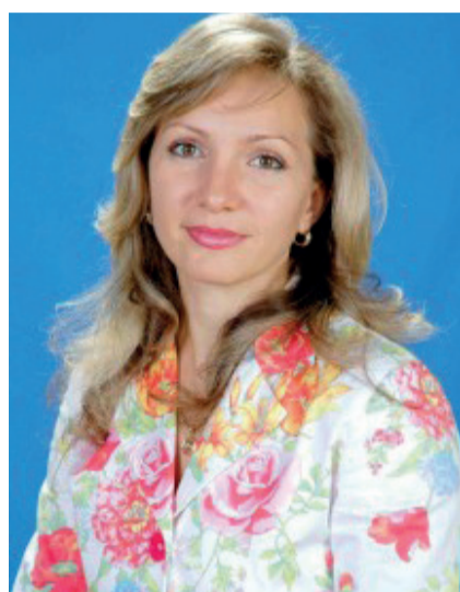
Председатель комитета Законодательного Собрания Ростовской области по молодежной политике, физкультуре, спорту и туризму, депутат Законодательного Собрания Ростовской области Л.Н. Тутова

Молодежная акция «Поезд будущего» – это мудрость и молодая сила, опыт и целеустремленность, вера и смелость!