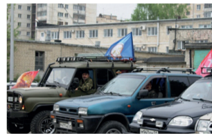
АВТОПРОБЕГ В БОКОВСКОМ РАЙОНЕ

900-летие со дня основания города, которое отмечалось в 1967 году. Эта дата дала отсчет движению города вперед.