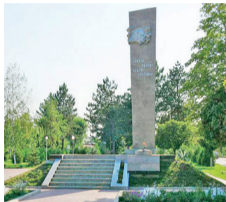
АЛЛЕЯ СЛАВЫ В САЛЬСКОМ РАЙОНЕ